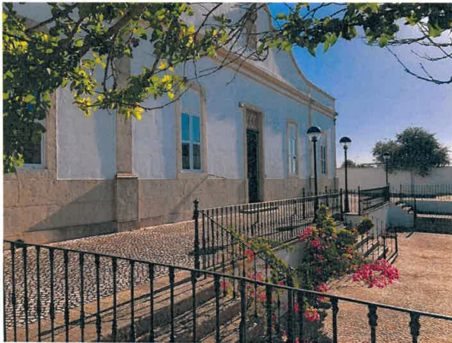
Figura nº2 – Antigo Hospital da Misericórdia