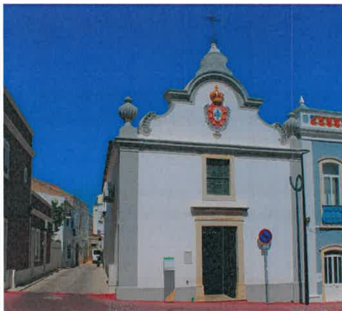
Figura nº 1– Igreja da Misericórdia