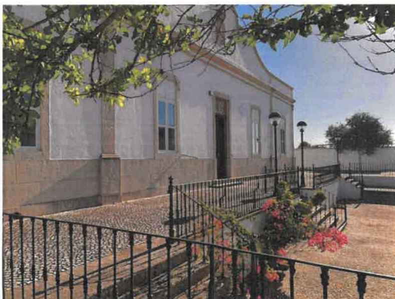
Figura nº2 – Antigo Hospital da Misericórdia