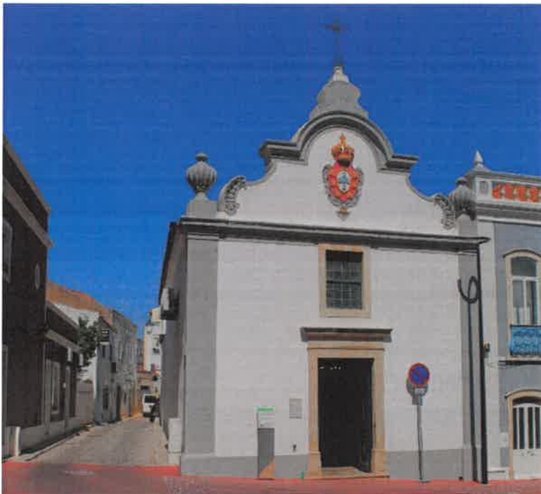
Figura nº 1– Igreja da Misericórdia

Para além do Património Imóvel já enunciado, como o antigo Hospital da Misericórdia situado na entrada poente da cidade de Lagoa, e a Igreja da Misericórdia perto do Mercado Municipal da mesma cidade, a SCML é ainda proprietária de um prédio rústico, com a área 10.240m 2 , sítio da Ribeira Baixa, inscrito na matriz predial com o nº40, e partilha com a Paróquia de Ferragudo a propriedade de um prédio urbano na proporção de 50% com o artigo matricial nº 303.